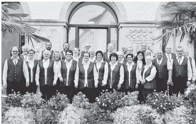
Die Vorfreude steht den Sängerinnen und Sängern ins Gesicht geschrieben.

Ein ganz besonderer Höhepunkt wird der Auftritt des Krauchenwieser Gesangvereins bei den Weintagen in Mór, ein großes Kultur- und Sportfestival, am Sonntagmorgen und die Teilnahme am anschließenden Festumzug sein. Die Sängerinnen und Sänger haben sich in intensiven Proben sehr gut auf den Auftritt vorbereitet und werden die Gemeinde Krauchenwies und die hiesige Chorszene würdig repräsentieren.