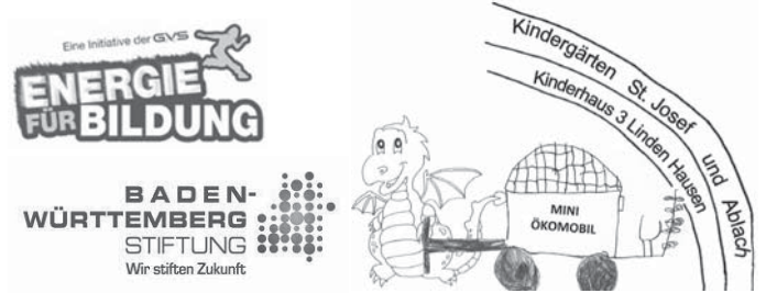
Mini-Ökomobil ist ein Projekt im Rahmen des Programms "Nachhaltigkeit lernen - Kinder gestalten Zukunft" der Baden-Württemberg Stiftung.

Auch die Schädigung der Haut durch Sonnenbrand ist bei Kindern noch gefährlicher als bei Erwachsenen. Die empfindlichen Stammzellen liegen bei Kindern viel dichter unter der Hautoberfläche und werden bei jedem Sonnenbrand geschädigt. Durch das Wachstum der Haut kommt es zur permanenten Teilung eben dieser geschädigten Zellen. Dadurch erhöht sich das Risiko später im Leben an Hautkrebs zu erkranken.