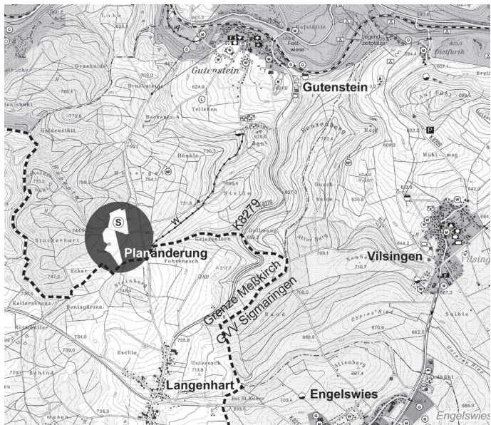
Übersichtsplan zur Lage der FNP-Änderung 018 PV Gutenstein-Reisen